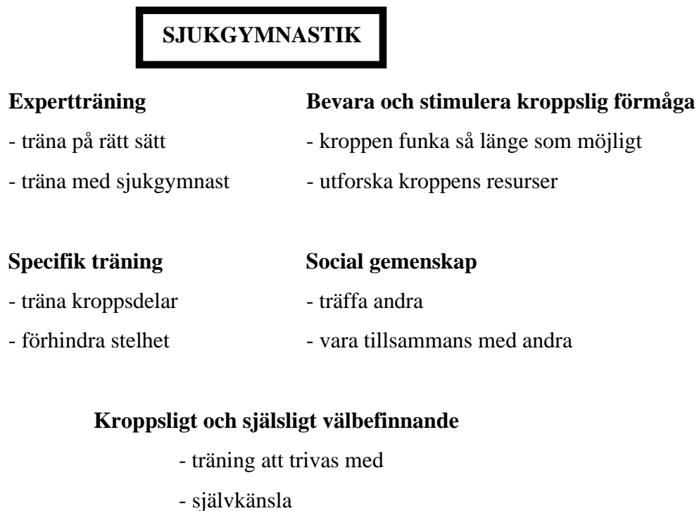
Figur 1. Tematisk beskrivning av de ungas vuxnas upplevelse av fenomenet sjukgymnastik.

vuxen ålder därför att de mådde bra av den. Andra avbröt all form av fysisk träning och idrott. Två personer hade pågående sjukgymnastik när intervjuerna gjordes. Däremot var det roligt i vatten. De teman som kunde härledas från de unga vuxnas upplevelse av sjukgymnastik var: (1) expertträning, (2) bevara och stimulera kroppslig förmåga, (3) specifik träning, (3) sjukgymnastik ger social gemenskap och (5) sjukgymnastik kan ge kroppsligt och själsligt välbefinnande. Den enda av de kvinnor och män jag intervjuade - den enda som upplevt sjukgymnastiken lustfylld som barn - ansåg att sjukgymnastikens mening var att bekräfta och stärka självkänslan (Figur 1).